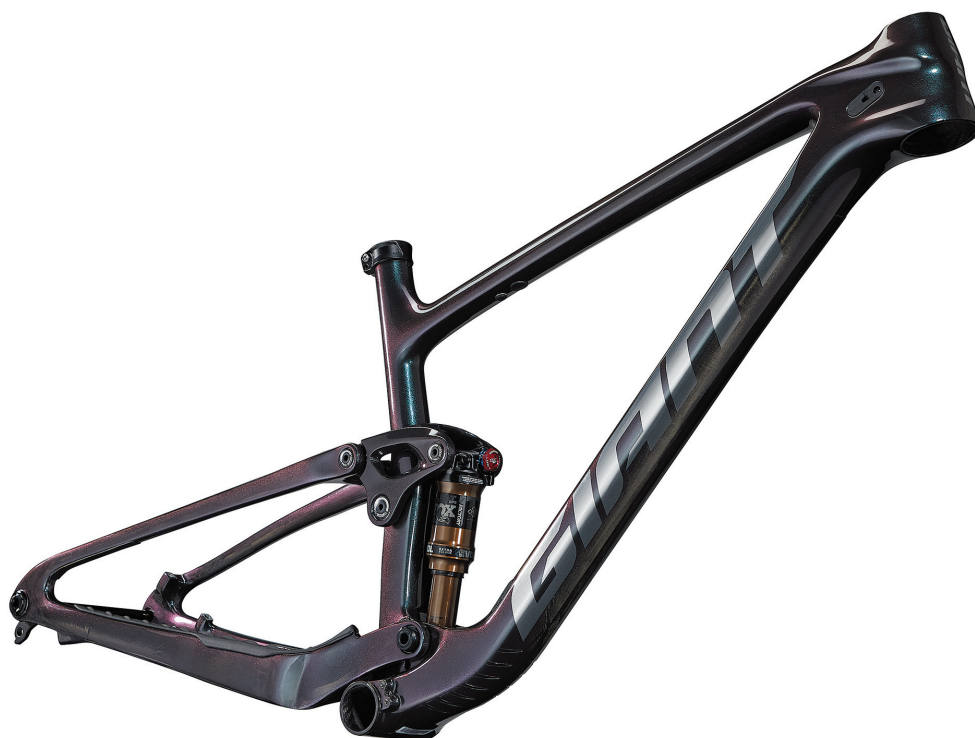
COLOR: アークティックライト

テクニカルで高速化する近年のクロスカントリー (XC) レースでの高いパフォーマンスを追求した新型「アンセム」。新たに採用したシングルピボットサスペンションシステム「FLEXPOINT PRO」とフルカーボンリアフレームによって、前世代比で250gもの軽量化を実現。幅広になったBBエリアが剛性を20%高め、67.5°にアップデートしたヘッド角と前110mm/後100mmストロークがハードな上りや下りでもコントロール性を高める、ピュアXCレーシングバイク。カーボン素材を見せながら見る角度によって色に変化する特殊なペイント「アークティックライト」を採用。