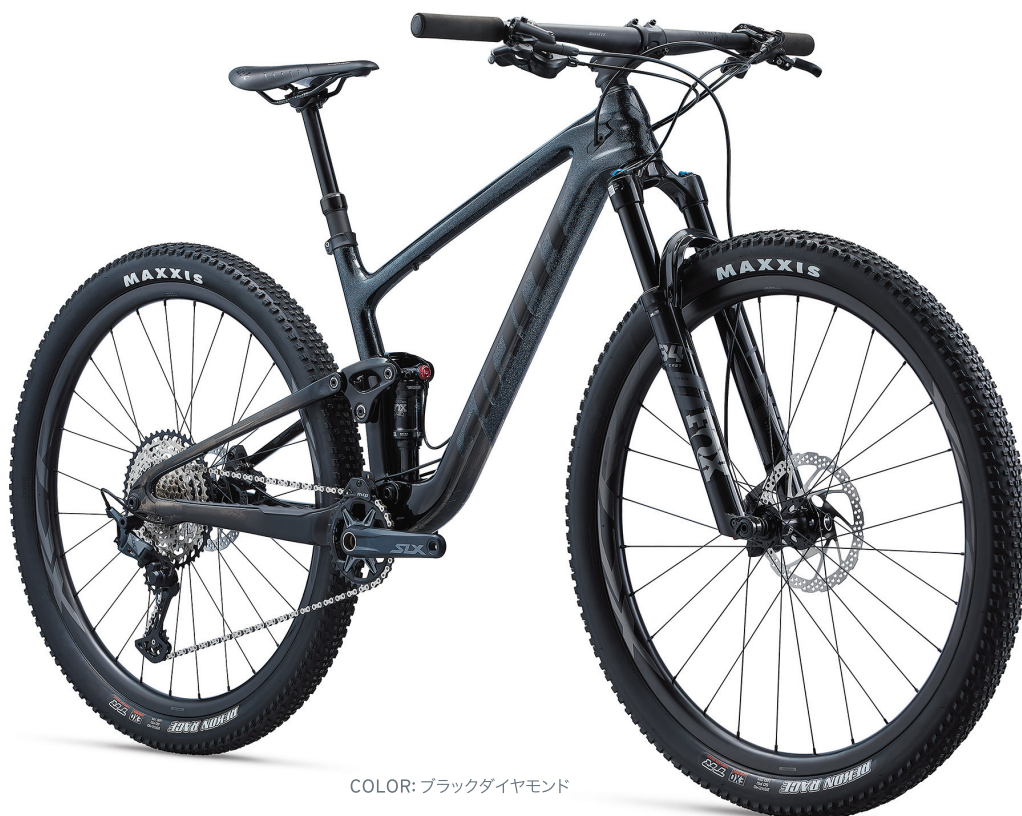
COLOR: ブラックダイヤモンド

テクニカルで高速化する近年のクロスカントリー (XC) レースでの高いパフォーマンスを追求した新型「アンセム」。新たに採用したシングルピボットサスペンションシステム「FLEXPOINT PRO」とフルカーボンリアフレームによって、前世代比で250gもの軽量化を実現。幅広になったBBエリアが剛性を20%高め、67.5°にアップデートしたヘッド角と前110mm/後100mmストロークがハードな上りや下りでもコントロール性を高める、ピュアXCレーシングバイク。