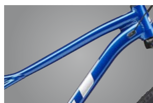
6061-T6 ハイドロフォームアルミフレーム 耐久性の高いアルミ合金をハイドロフォームで複雑に形状を変化させ、軽さと強さが向上。テーパヘッド、141mmエンド、内装ケーブルの上級フレーム。