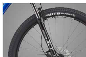
SR SUNTOUR XCT 世界最大のサスブランドSR SUNTOUR。登りでは油圧式ロックアウト機構をONすることでパワーロスを防止できる。