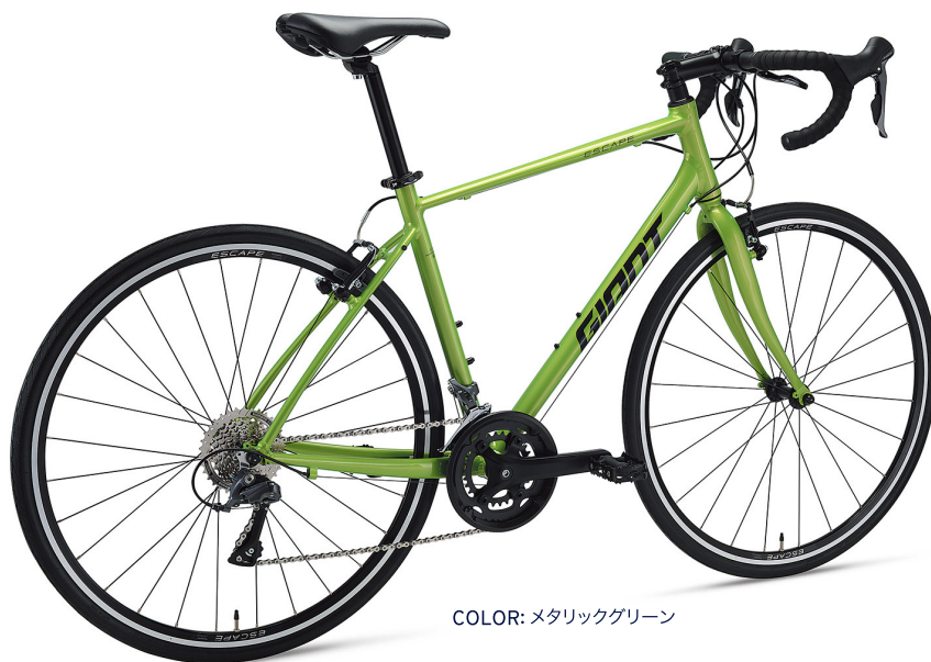
COLOR: メタリックグリーン

ベストセラークロスバイク「エスケープ R3」のドロップバー仕様。ドロップバー用に最適化されたジオメトリに、初心者にも安心のサブブレーキレバー、やや太めの30Cタイヤ、快適サドル。リラックスした乗車姿勢でロードバイクスタイルを楽しめる、ドロップバークロスバイク。