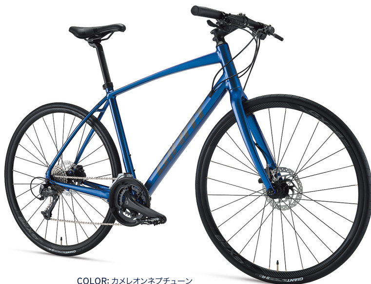
COLOR: カメレオンネブチューン

ロードバイク譲りの走行性能をもつ軽量アルミフレームの「エスケープRX」。ステアリング剛性を向上させるOVERDRIVEフォークを採用、フロントダブル仕様でシンプルな操作性と軽量性を獲得。「DISC」は最新規格のフラットマウントディスク台座と軽量フルカーボンフォークを採用。カメレオンネブチューンは見る角度によって色が変わって見えるスペシャルペイント。