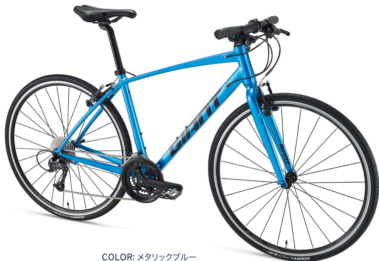
COLOR: メタリックブルー

ロードバイク譲りの走行性能をもつ軽量アルミフレームの「エスケープRX」。ステアリング剛性を向上させるOVERDRIVEフォークを採用、フロントダブル仕様でシンプルな操作性と軽量性を獲得。D-FUSEシートピラーやコンフォートサドルによる快適性と相まって、クロスバイクの域を超える上質なスポーツライドを実現。