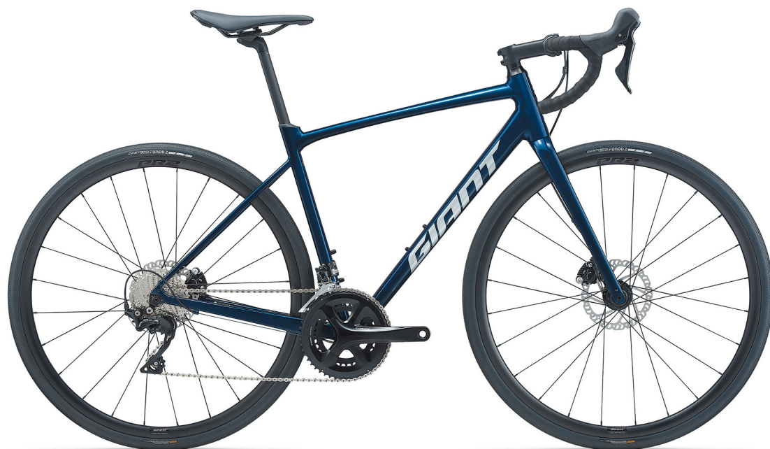
COLOR: メタリックネイビー

「コンテンド」をベースとし、高めのスタックハイトと38Cタイヤまで装着可能なフレームが特徴の「コンテンドAR」シリーズ。前後12mmスルーアクスル+フラットマウントの最新規格に、D-Fuseピラーと32Cタイヤ、フェンダー装着などの汎用性が、アドベンチャーサイクリングの世界を切り開く新コンセプトのオールロード。