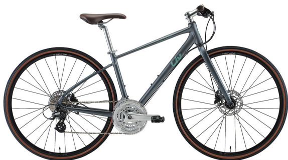
マットチャコール