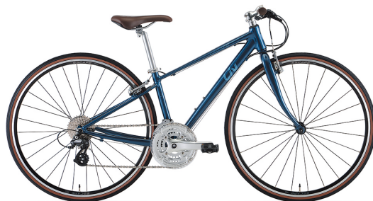
クラシックブルー