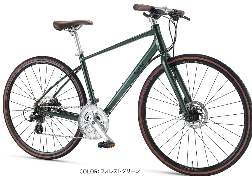
COLOR: フォレストグリーン

日本女性のライフスタイルにちょうどよい「エスケープR3 W」にディスクブレーキバージョンが新登場。ディスクブレーキはバイクや衣服が汚れにくく、快適なサイクリングを楽しめます。身体への負担が少ないフレームと幅広タイヤ、フィット感のいいグリップ、柔らかいサドルで快適に。