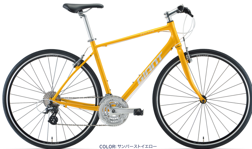
COLOR: サンバーストイエロー

国内クロスバイクの代名詞的存在、ジャイアントジャパンのベストセラー「エスケープ R3」。快適性を高める扁平トップチューブとオフセットシートステイ採用の軽量フレームに、安定性のあるための30Cタイヤ、エルゴグリップを採用。クッション性の高いサドルは、アクセサリをスマートに装着可能なユニクリップシステムを搭載。通勤、通学、週末サイクリングまで、快適走行でサイクリングライフをサポート。新たにXXSサイズを追加。