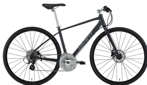
マットダークシルバー