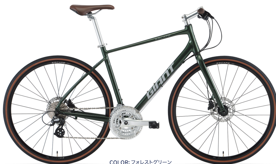
COLOR: フォレストグリーン

ベストセラークロスバイク「エスケープ R3」の、ディスクブレーキバージョン。快適性の高いフレームに、太めの30Cタイヤとエルゴグリップ、クッション性の高いユニクリップシステム搭載の新型サドル。全天候で高い安定性を発揮する油圧ディスクブレーキの採用で、通勤、通学、週末サイクリングまで安心かつ快適に。新たにXXSサイズを追加。