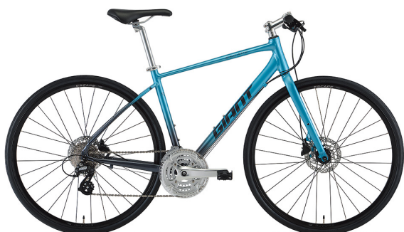
ブルー・ダークシルバー