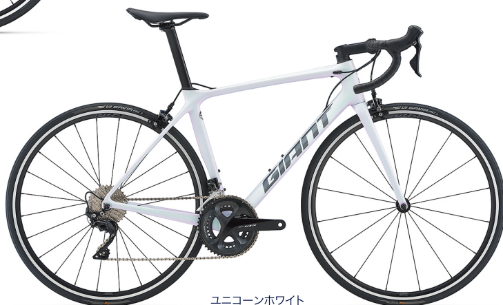
ユニコーンホワイト