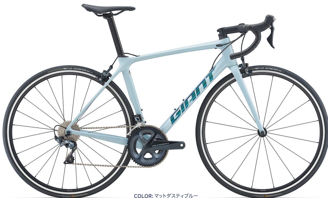
COLOR: マットダスティブルー

卓越した重量剛性比により効率性が進化したアドバンスド・グレードのカーボン素材に、エアロダイナミクスに優れる新型チューブ形状を採用。新たにフルカーボンフォークを装備し、重量を抑えながら剛性が向上。ワイドギアレンジの「KOM」仕様でヒルクライムにも対応する。デカールには見る角度によって色が変化して見えるカメレオンカラーを採用。