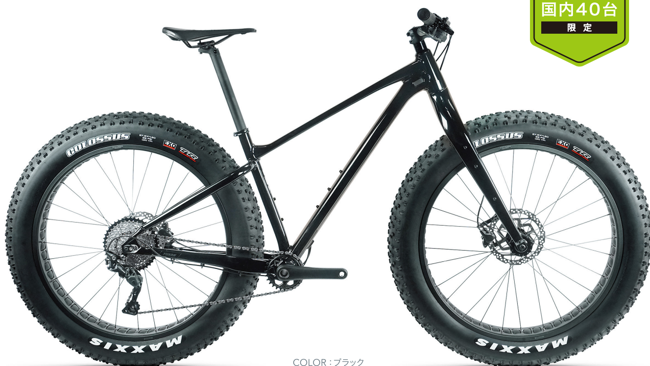
COLOR : ブラック